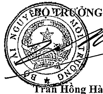
Trần Hồng Hà